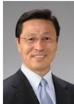
いなべ福王ラリー2014 大会名誉会長

「いなべ福王ラリー2014」が菟野町いなべ市で開催されますことを心からお喜び申し上げます。今年で3回目を迎えられ、地域の皆さんにも広く知られるモータースポーツの大会となり、大きなイベントとして地域振興の一翼を担っていただいています。鈴鹿山系の麓に位置する会場では、白熱するレース展開と緑が溢れる自然の魅力を満喫していただけることと思います。最後に、開催にご尽力いただきます関係者の方々に深く感謝するとともに、参加されます選手及びチームの皆様方のご活躍とご健闘を心からお祈りいたします。