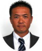
いなべ福王ラリー2013 大会名誉副会長

三回目を迎える「いなべ福王ラリー2014」の開催、心よりお祝い申し上げます。開催を重ねる舞に関心が高まり、ボランティアの方々そして地元の方々のご理解ご協力が増え、観客数が増える事で交流人口が増える事は菟野町・いなべ市にとっても喜ばしいことで、関係各位には心より感謝を申しあげます。地域振興を目的としたこのラリーは世代間・地域間を超え「人と人」をつなげる素晴らしいイベントになると思います。これからも地域の方々と一緒に盛り上げ「日本一のラリー」を目指し、私も一人のスタッフとして尽力していきたいと思っております。今年も皆さんと一緒にこのイベントを成功させましょう。